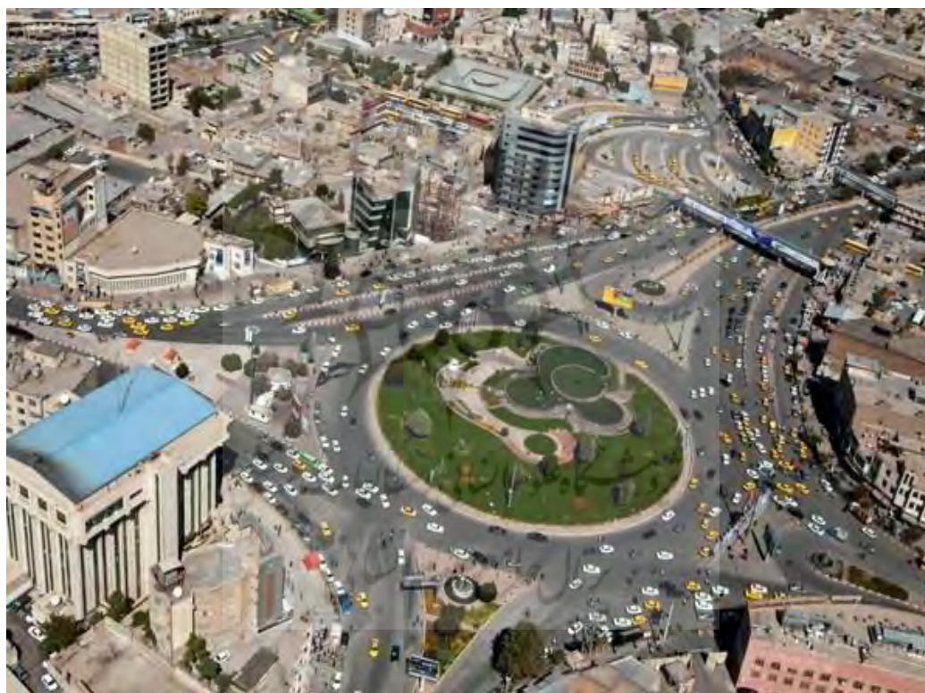
شکل ۳. تصویر بافت مرکزی در شهر کرمانشاه

محدوده اولیه شناسایی شده بافت فرسوده در شهر کرمانشاه ۱۰۵۰ هکتار بوده است که با پیشنهاد شهرداری کرمانشاه مبنی بر افزایش ۷۸ هکتار به محدوده و تأیید کمیسیون ماده ۵، محدوده نهایی به ۱۱۲۸ هکتار افزایش یافته است. بافت مرکزی شهر کرمانشاه به عنوان بخشی از این بافت فرسوده با مساحتی حدود ۳۶۰ هکتار تنها ۳/۶ درصد از شهر کرمانشاه را اشغال کرده است. اما با این وجود به لحاظ اقتصادی و اجتماعی دارای ارزش بسیار بالایی است (شکل ۳).