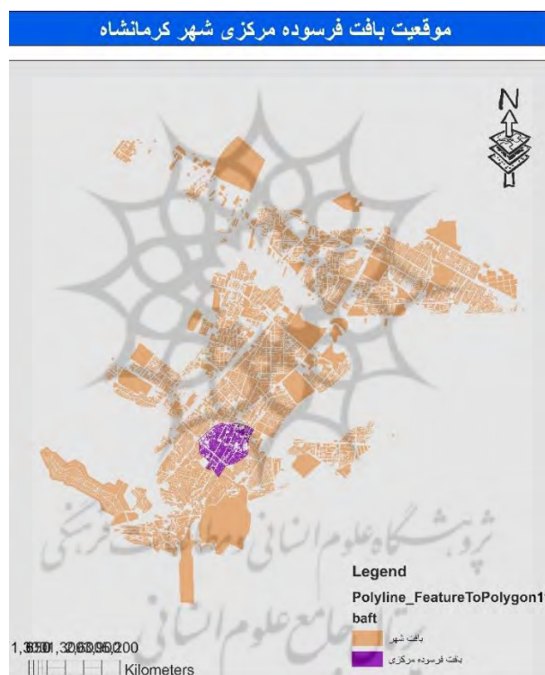
شکل ۲. نقشه موقعیت بافت فرسوده مرکزی در شهر کرمانشاه

شهر کرمانشاه در نیمه شرقی استان کرمانشاه، بین ۳۴ درجه و ۱۹ دقیقه عرض شمالی و ۴۷ درجه و ۷ دقیقه طول شرقی از نصف‌النهار گرینویچ قرار گرفته است. این شهر دارای جایگاه نسبتاً بالایی در نظام سلسله مراتب شهری ایران می‌باشد و به عنوان نهمین شهر بزرگ ایران در میان بیش از ۱۰۰۰ شهر بزرگ و کوچک حائز رتبه‌ای درخور توجه است. بر اساس آخرین اطلاعات این شهر دارای جمعیتی حدود ۹۴۵۲۸۵ نفر می‌باشد (مرکز آمار ایران، ۱۳۹۵). بافت مرکزی شهر کرمانشاه به مثابه قلب تپنده شهر که مرکز فرماندهی اقتصادی و اجتماعی را تشکیل می‌دهد دارای اهمیت فوق العاده‌ای است (شکل ۲)