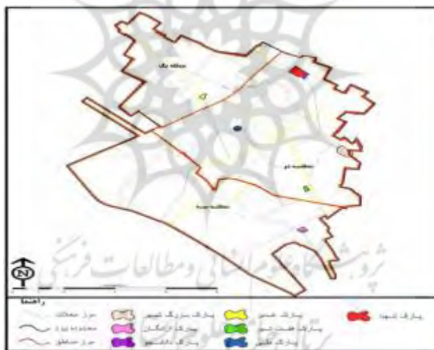
شکل ۱. موقعیت جغرافیایی پارک‌های مورد مطالعه در شهر یزد

مطالعه موردی این پژوهش را پارک‌های ناحیه‌ای شهر یزد تشکیل می‌دهد. این شهر در شرق اصفهان و جنوب کویر لوت با طول جغرافیایی ۵۴ درجه و ۲۴ دقیقه و عرض جغرافیایی ۳۱ درجه و ۲۵ دقیقه در مرکز ایران قرار گرفته است. این شهر ۸۷ کیلومتر مربع است و ارتفاع متوسط آن از سطح دریا ۱۲۳۰ متر است. بر اساس آخرین سرشماری عمومی نفوس و مسکن (سال ۱۳۹۵)، جمعیت این شهر بالغ بر ۱۵۸۳۶۸ خانوار و ۵۲۹۶۷۳ نفر بوده است. شهر یزد دارای ۱۶۵ پارک با مساحت ۱۸۶۳۶۲۹ متر مربع بوده که ۵۵ پارک آن با مساحت ۳۰۰۲۱ متر مربع زیر ۱۰۰۰ متر مربع و ۵۱ پارک آن نیز با مساحت ۱۳۰۹۲۲ متر مربع بین ۱۰۰۱ تا ۵۰۰۰ متر مربع است. در این بین پارک‌های ناحیه‌ای شهر یزد (پارک‌های غدیر، شهید، بزرگ شهر، دانشجو، هفت‌تیر، آزادگان، و باغ ملی) با دارا بودن ۷۰۸۰۰۰ متر مربع مساحت، معادل ۳۷/۹ درصد از مساحت کل پارک‌های شهر یزد، به دلیل امکانات و خدمات فراوان نسبت به سایر پارک‌ها، مهم‌ترین پارک‌های این شهر از نظر جذب جمعیت و بیشترین تعداد بازدیدکننده‌اند (سرای و همکاران، ۱۳۹۲: ۱۲۵).