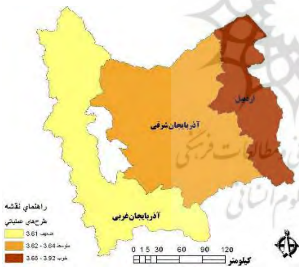
نگاره ۲: نقشه مقایسه وضعیت سه استان بر اساس میزان کاربست شاخص‌های آمایش مرز در پیاده‌سازی و اجرای طرح‌های امنیتی مرزی

بر مبنای خروجی تحلیل آماری، در رتبه اول استان اردبیل با میانگین کلی ۳/۹۲ در رتبه دوم استان آذربایجان شرقی با میانگین کلی ۳/۶۴ و در رتبه سوم استان آذربایجان غربی با میانگین کلی ۳/۶۱ قرار گرفتند.