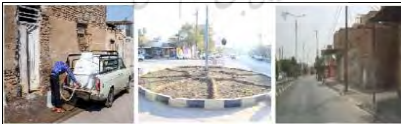
شکل (۴). معبر اصلی در محلّه عامری (راست)، میدان در محلّه غزعلیه (وسط) و واحد مسکونی فرسوده در محلّه حصیرآباد (چپ)