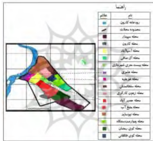
شکل (۳). موقعیت محلات منطقه هفت شهری کلانشهر اهواز