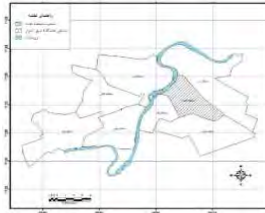
شکل (۲). موقعیت هشت منطقه شهری کلانشهر اهواز