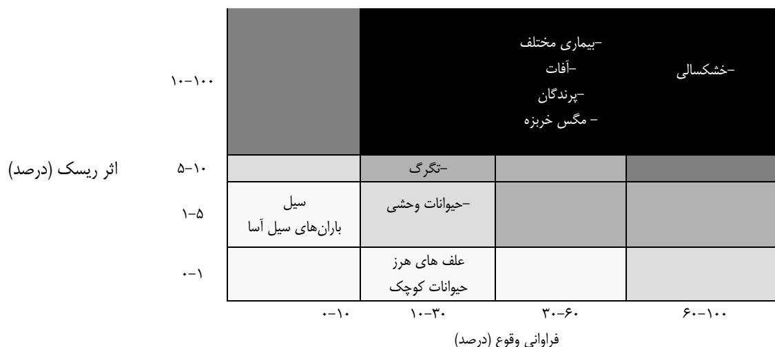
شکل ۲. ماتریس ریسک تولید خربزه در سال ۱۳۹۷