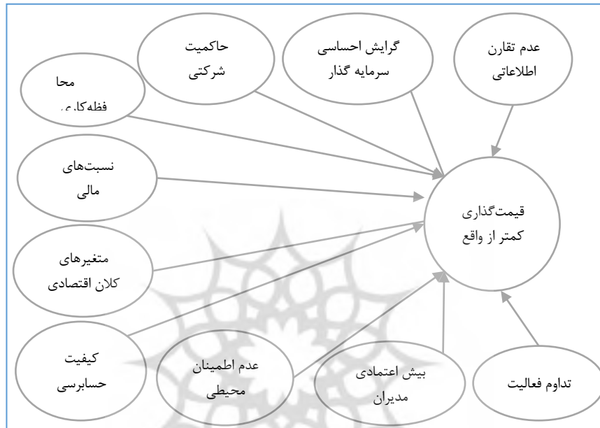
شکل ۱. الگوی مفهومی پژوهش

الگوی مفهومی پژوهش براساس رویکرد مدل‌سازی معادلات ساختاری به شکل زیر ترسیم شده است.