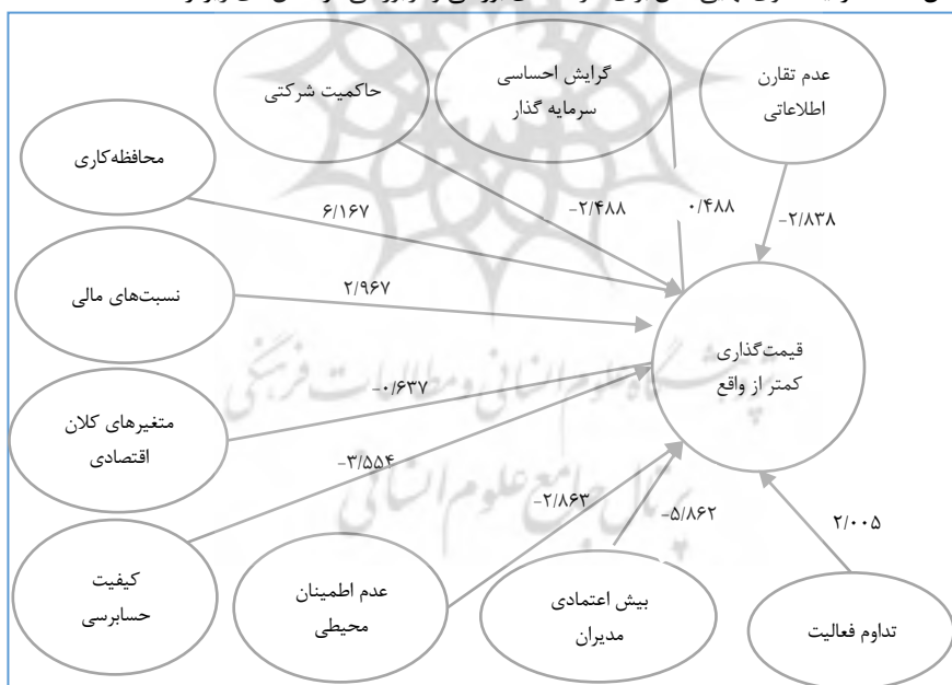
شکل ۲. الگوی نهایی پژوهش-شرکت‌های بورسی

پس از ارزیابی مدل سنجش و مدل ساختاری پژوهش حاضر و آزمون مسیرهای موجود در مدل اولیه، با توجه به مقادیر ضرایب مسیر بین متغیرها و سطح معناداری آنها، مسیرهایی که مقادیر ضرایب مسیر و سطح معناداری آنها مناسب نبود، از مدل حذف گردید. الگوی نهایی مدل برای شرکت‌های بورسی و فراپورسی در شکل‌های زیر ارائه شده است.