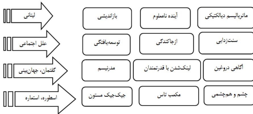
شکل ۱. مدل تحلیل لایه‌ای علی برای سبک زندگی اقتصادی

این نکته مورد تأکید قرار دارد که سبک زندگی اقتصادی، مجموعه‌ای از مضامین به هم تنیده در پیوند با لایه‌های مختلف از واقعیت است؛ یعنی مسایل عینی و روزمره که در سطح لیتانی اتفاق می‌افتد، چه بخواهیم و چه نخواهیم با محیط، بافت و نظام‌های اجتماعی، با جهان‌بینی و گفتمان‌های منبعث از آن و با اسطوره‌ها و استعاره‌های حاکم بر جامعه درهم تنیده است (بابادی و همکاران، ۱۳۹۶: ۲۲).