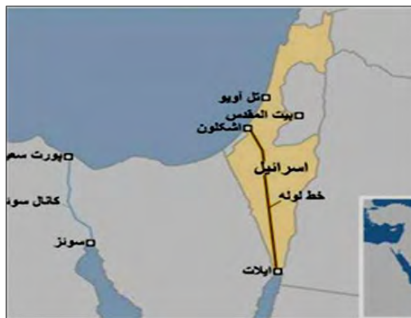
نقشه ۱- انتقال نفت و گاز امارات به مناطق اشغالی از طریق خط لوله ایلات اشکلون