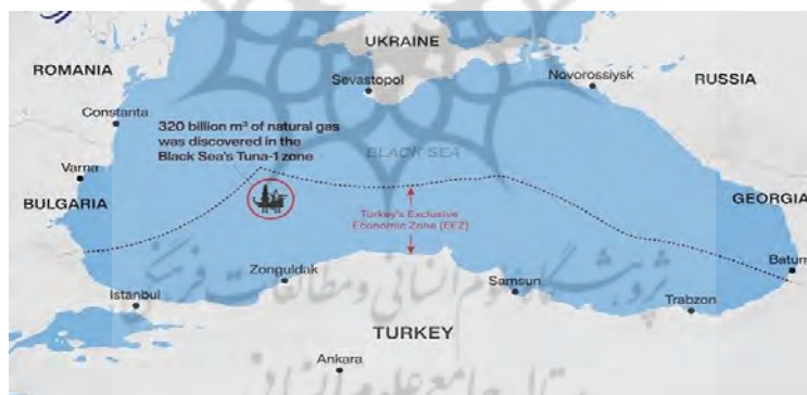
تصویر 4. مکان اکتشاف میدان نفت و گاز جدید ترکیه

حمایت از قبرس به‌عنوان یکی از اعضای اتحادیه اروپا، از ترکیه خواست که به حقوق مستقل کشورهای عضو اتحادیه اروپا احترام بگذارد (Aqayari, 2019). به نظر می‌رسد، اختلاف‌های ترکیه و اتحادیه اروپا بر سر مسئله اکتشافات انرژی این کشور به‌راحتی حل‌شدنی نباشد. ادامه این تنش‌ها باعث شده است که سران اتحادیه اروپا بر سر اعمال تحریم‌های اقتصادی ترکیه با هم توافق کنند و این خبر بدی برای ترکیه است. به‌همین دلیل، اردوغان در تماس با شارل میشل، رئیس شورای اروپایی، خواستار بازگشایی صفحه جدیدی در روابط ترکیه و اتحادیه اروپا شد (Irna, 11/01/2021). اتحادیه اروپا، فعالیت‌های ترکیه در شرق مدیترانه را به‌دیده رفتارهای نامناسب و اقدامات یک‌جانبه می‌نگرد و انتظار دارد، ترکیه به‌عنوان شریک مهم این اتحادیه — که برای پیوستن به آن تلاش می‌کند — این نگرانی‌ها را درک کرده و از افزایش آن خودداری کند. البته ترکیه در میدان گسترده و حساس هیدروکربنی شرق مدیترانه، تنها با بخش روم‌نشین قبرس، یونان، و اتحادیه اروپا طرف نیست، بلکه شیطنتهای برخی از کنسرسیوم‌های بزرگ وابسته به رژیم صهیونیستی و شرکت‌های آمریکایی نیز منافع بلندمدت ترکیه را در این منطقه تهدید می‌کند و جالب اینجاست که مصر نیز، از دور دستی بر این آتش دارد و از آنجاکه اردوغان به‌دلیل ماجرای کودتا، اخوان‌المسلمین، و مرگ محمد مرسی و همچنین، اعدام بسیاری از فعالان وابسته به جریان اخوان‌المسلمین، از ژنرال سیسی ناخشنود است، در پی این است که به مصر و دیگران فرصت عرض اندام ندهد (Tasnim, 09/08/219).