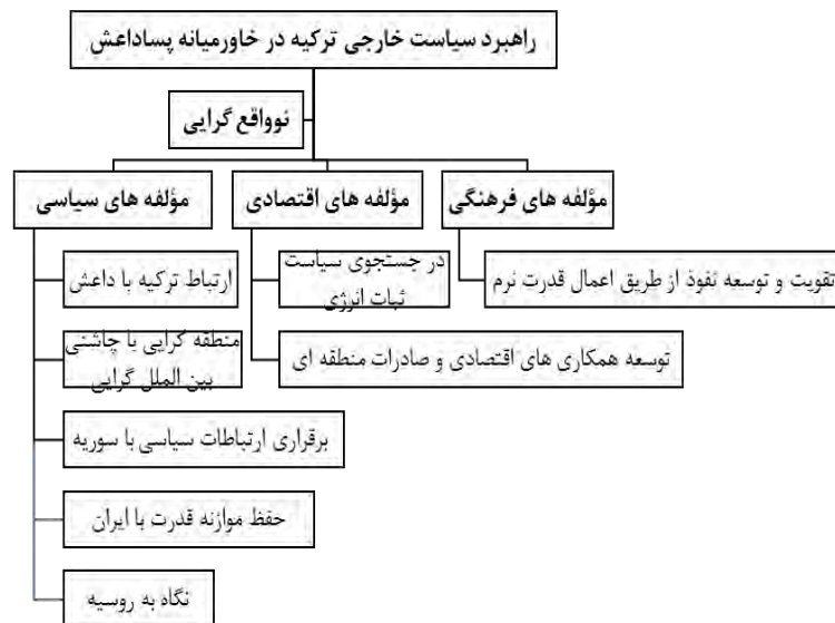
شکل 1. چارچوب مفهومی پژوهش