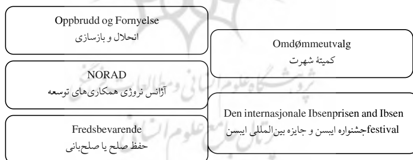
شکل 3. ابتکارها و فعالیت‌های سیاست‌گذارانه دیپلماسی فرهنگی دولت نروژ برای تصویرسازی مثبت

سفارتخانه‌های این کشور را به یک درگاه متمرکز در نروژ متصل کرده است (Norway.info). این درگاه، اکنون چهره رسمی نروژ را به جهانیان نشان می‌دهد و در سال‌های متمادی، از جمله در سال‌ها 4444 و 8888، جایزه شورا طراحی نروژ را دریافت کرده است. دیپلماسی نروژ به گونه‌ای هم‌زمان، به صورت متمرکز و کورپوراتیستی ساخت‌بندی شده است. وزارت امور خارجه این کشور، هماهنگ‌کننده اصلی شیوه‌ارائه نروژ در خارج از کشور است (Popa, 2015: 44). براین اساس، مجموعه‌ای از تصویرها و ارزش‌ها که ذات نروژ را به صورت یک هویت نمادین نشان می‌دهند، ترکیب اصلی مدیریت تصویر و شهرت نروژ در خارج از کشور به‌شمار می‌آیند. این تصویرها و ارزش‌ها (صلح، طبیعت، و برابری) مؤلفه‌های نمادینی هستند که در هر جامعه‌ای، خریدار دارند و می‌توانند جذابیت ایجاد کنند. همه بازیگران نروژی (چه دولتی و چه غیردولتی) برای ارتقای ارزش‌های محوری این کشور، یعنی صلح، طبیعت، و برابری، در عرصه بین‌المللی تلاش می‌کنند. گروه‌های نروژی، مرز نمی‌شناهند و به همین سبب، فعالیت‌هایشان برای جهانیان ارزشمند و جذاب است و بیشتر رژیم‌های سیاسی، مخاطبان عادی، مذاهب گوناگون، و نهادهای بین‌المللی، فعالیت صلح‌محور این کشور و گروه‌های مختلف غیردولتی آن را به رسمیت شناخته‌اند (Taulbee, Kelleher and Grosvenor, 2014b: 41). پنج اقدام و ابتکار مهم، دیپلماسی فرهنگی نروژ در خارج از مرزهای این کشور را هدایت می‌کنند که ابزارهای اصلی برندسازی و مدیریت شهرت و تصویر مثبت نروژ و عامل اصلی افزایش جذابیت این کشور در خارج از مرزهای آن به‌شمار می‌آیند. این پنج عامل را در شکل شماره (3) مشاهده می‌کنید.