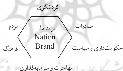
شکل 1. الگوی شش ضلعی سیمون آنهولت

آنهولت در کتاب بعدی خود با عنوان «هویت رقابتی: مدیریت برند جدید برای ملت‌ها، شهرها، و مناطق» 4 ، این الگورا در قالب شاخص شش ضلعی 5 برندینگ ملت کامل کرد. این شش ضلع، نشان‌دهنده شش مسیر طبیعی ارتباطات جهانی برای کشورها هستند. این شش ضلعی را به عنوان شاخص آنهولت در شکل شماره (1) مشاهده می‌کنید. کتاب «هویت رقابتی» وی بر پایه تحلیل این شش ضلع در زمینه شهرت بین‌المللی کشورها و مفهوم هویت رقابتی شکل گرفته است (Anholt, 2007). آنهولت در مقاله‌های دیگرش با تحلیل گسترده‌تر این شش ضلعی و ترکیب آن‌ها، کشورهایی را که در زمینه برند ملی موفق بوده‌اند، کشورهای دارای هویت رقابتی می‌داند. وی هویت رقابتی و برندینگ ملی کشورها را بر پایه این شش ضلع تحلیل کرده است.