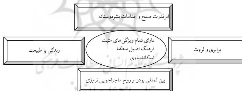
شکل شماره (2). ویژگی‌های (مؤلفه‌های) اصلی دیپلماسی فرهنگی و تصویرسازی نروژ در نظام بین‌المللی

نروژی‌ها، برای تغییر این دیدگاه، اقدام به تغییر و بازسازی تصویر کشورشان در محیط بین‌المللی کرده‌اند. براین اساس، حوزه اصلی برند سازی نروژ و مدیریت شهرت بین‌المللی این کشور، مسئله صلح و اقدامات بشردوستانه بوده است. نروژی‌ها، اکنون خودشان را یک ابرقدرت در حوزه اقدامات بشردوستانه 1 و صلح سازی معرفی می‌کنند (Saxi, 2010: 94). افزون بر این ویژگی، مؤلفه‌های دیگری نیز برند و ادراک تصویر نروژ در خارج از کشور را هدایت می‌کنند که عبارتند از: مردمی که با طبیعت زندگی می‌کنند، برابری طلب هستند، به ارزش‌های بین‌المللی احترام می‌گذارند، با اهداف جهان‌نو هماهنگی پیدا می‌کنند، و روحیه‌ای ماجراجویانه دارند. نقطه تمرکز این ویژگی‌ها، پیوند ایده هویت نروژی با منطقه اسکاندیناوی و فرهنگ آن است (Block, 2019). نروژی‌ها، خود را بیشتر از تمام ساکنان سوئد و دانمارک، اسکاندیناویایی می‌دانند و تأکید می‌کنند که نروژی‌ها، بیشترین نزدیکی را به ویژگی‌های فرهنگ سنتی و تاریخی منطقه اسکاندیناوی دارند. شکل شماره (2)، ویژگی‌های اصلی دیپلماسی فرهنگی نروژ و مبانی تصویرسازی ملی آن را در نظام بین‌المللی نشان می‌دهد.