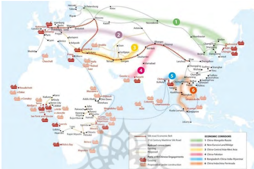
تصویر ۱. مسیرهای شش گانه طرح یک کمربند، یک جاده چین

مسائل امنیتی بین هند و چین، این مسیر احتمالاً کندتر پیش می‌رود (OECD, 2018, p 11).