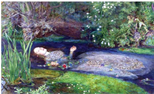
تصویر ۱. نقاشی اورت

نشانه‌های شخصیت خود را در اثرش تجلی دهد اگرچه مؤلفه‌های اثر اصلی هم چنان در اثر دوم هویدا است. به‌طور مثال، جان / اورت نقاش انگلیسی با نگاهی وفادارانه به اثر فاخر هملت تلاش می‌کند تصویری را از مرگ اُفلیا ترسیم کند. این نقاشی به شدت به فضا و شخصیت‌پردازی داستان نزدیک است و مخاطب می‌داند که نقاش درباره چه موضوعی صحبت می‌کند اما درعین‌حال طراحی گل‌ها و ترسیم فضای شاعرانه از هنر نقاش است که آن را به اثری مستقل تبدیل می‌کند. در این قسم از اقتباس، تکثیر مستقیم مؤلفه‌های اثر اول صورت نمی‌گیرد. چنانچه در نقاشی مذکور، تکثیر عبارات رمان هملت یا دیالوگ‌ها رخ نمی‌دهد و اساساً قالب اثر دوم متفاوت از اثر اول است. لذا در اینجا بحث ورود به حق تکثیر مؤلف اول منتفی بوده اما پرسش مهم آن است که آیا حق اقتباس مؤلف همچنان وجود دارد؟ مؤلف اثر دوم، به تصویرسازی یک شخصیت از داستان هملت دست زده است. اقدامی که بر اساس داستانی بوده که شکسپیر ترسیم کرده است. به‌عبارت‌دیگر، اگر آن فضا سازی دقیق شکسپیر نبود این نقاشی نیز طراحی نمی‌شد؛ بنابراین، می‌توان گفت اورت از هملت اقتباس کرده است اما نشانه‌هایی از شخصیت خود را نیز به اثر قبلی افزوده به‌گونه‌ای که اثر وی نزد مخاطبان اثری مستقل است که از ارزش‌های خود بهره‌مند می‌شود.