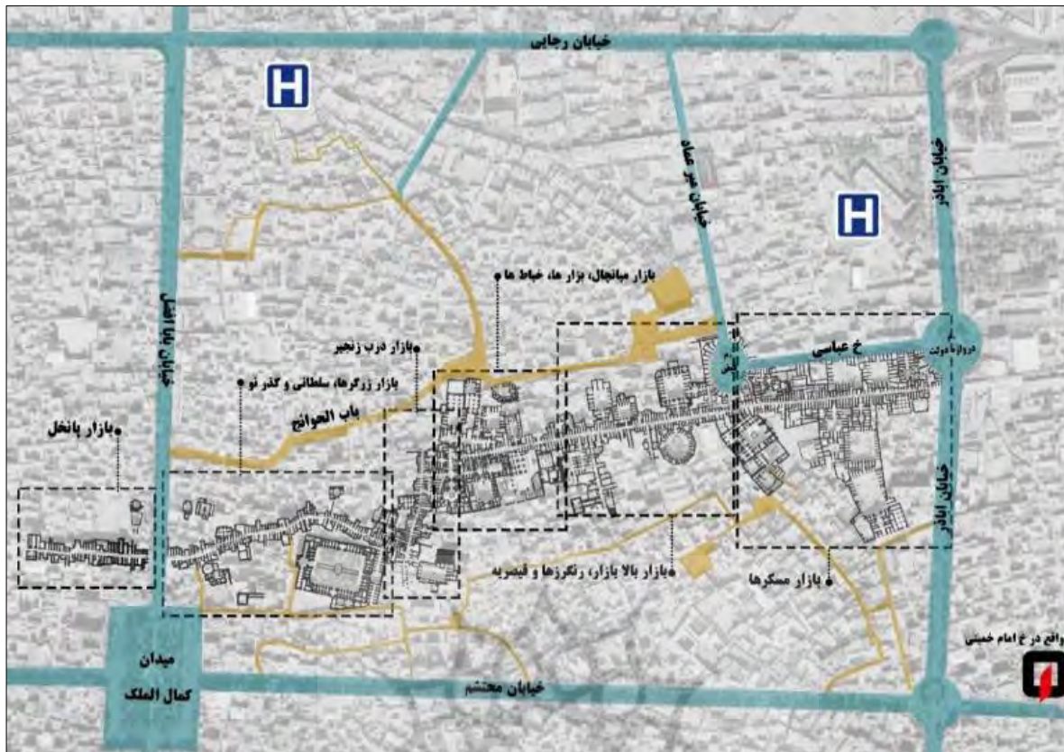
تصویر ۱- محدوده‌ی بازار کاشان انطباق بر روی عکس هوایی ۱۳۷۵ کاشان همراه با جانمایی مراکز درمانی و اورژانسی پس از سانحه