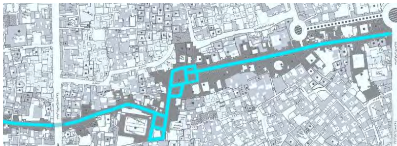
تصویر ۳- الگوی انتزاعی مسیرهای دسترسی اصلی در بازار کاشان