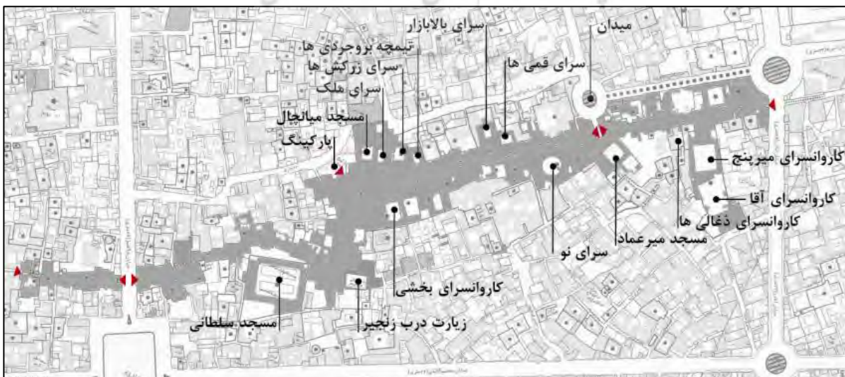
تصویر ۲- محدوده فضای پر و خالی مجموعه بازار و بافت اطراف و نمایش فضای باز مجموعه بازار کاشان

الف) فضاهای باز در بازار کاشان: فضای باز در بازار، شامل حیاط بناها و پارکینگ‌های احداثی در مجموعه بازار است. در مواقع بحرانی و حادثه، فضاهای باز هر مجموعه اولین نقطه برای تخلیه‌ی افراد است؛ بنابراین موقعیت قرارگیری و شرایط کالبدی آن‌ها حایز اهمیت است. موضوع مهم دیگر، امکان اسکان موقت در آنها، بعد از بحران است. فضاهای باز عمده در بازار معمولاً شامل: سراها، کاروانسراها و حیاط مساجد و مدارس هستند.