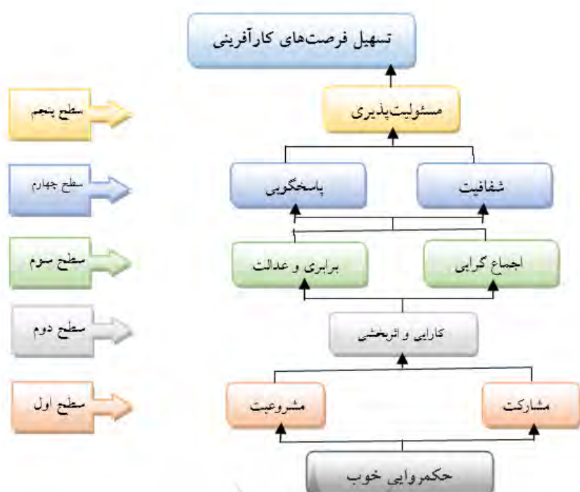
شکل ۲. طراحی مدل ISM از شاخص‌های حکمروایی خوب در تسهیل فرصت‌های کارآفرینی در مناطق روستایی گمیشان

آنالیز MICMAC: تحلیل میک مک با تقسیم زیرمعیارها به چهار دسته خودمختار، وابسته، مستقل و ارتباطی (پیوندی) به درک ماهیت زیرمعیارها کمک می‌کند، به علاوه طبقه‌بندی زیرمعیارها نیز آسان‌تر می‌کند. همان‌طور که در شکل ۳ پیدا است، در این مرحله نوع متغیرها با توجه به اثرگذاری و اثرپذیری بر سایر متغیرها مشخص شده است، و پس از تعیین قدرت نفوذ یا اثرگذاری و قدرت وابستگی عوامل می‌توان تمامی شاخص‌ها را در یکی از خوشه‌های چهارگانه روش ماتریس اثر متغیرها طبقه‌بندی کرد.