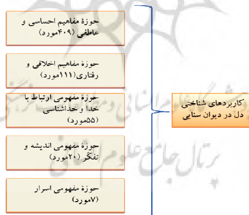
شکل ۱: کاربردهای مفهوم‌سازی «دل»

یکی از مهم‌ترین نقش‌های استعاره‌ی دل در ادب فارسی و پیرو آن در اشعار سنایی، کاربرد آن در مفهوم‌پردازی پدیده‌های متنوع و فراحسی چون: امیال، عواطف و احساسات درونی، صفات شخصیتی و اخلاقی، رازناکی و محل سر بودن، مبانی معرفتی و اندیشه‌ای و نظرگاه خداوند بودن است. درحقیقت، مفهوم دل ابتدا به‌منزله یک قلمرو ذهنی و مجرد در قالب سه استعاره ساختاری، هستی‌شناختی و جهت‌ی ملموس شده است؛ سپس می‌توان آن را حوزه‌ای مبدأ برای درک پدیده‌های نامحسوس فوق‌قلمداد کرد و نقش شناختی دل در فهم و دریافت این مفاهیم دارای اهمیت و قابل بررسی است. پرکاربردترین نقش شناختی دل درباره مفاهیم فوق به ترتیب بسامد در شکل ۱ آمده است: