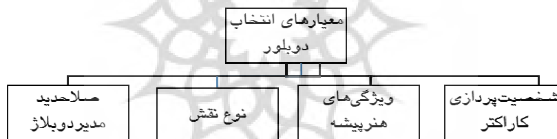
نمودار ۱: معیارهای انتخاب دوبلور در ایران

پس از پایان کدگذاری داده های جمع آوری شده طی مصاحبه ها، معیارهای انتخاب دوبلور از سوی پژوهشگر در چهار دسته ای که آورده می شود طبقه بندی شدند: انتخاب دوبلور متناسب با شخصیت پردازی کاراکتر، ویژگی های هنرپیشه، نوع نقش و صلاحیت مدیر دوبلاژ (نمودار ۱).