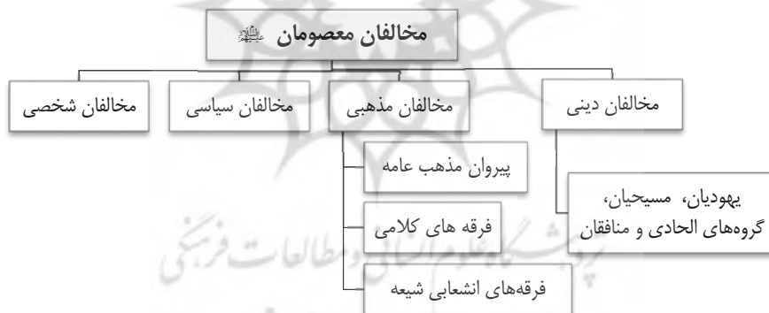
نمودار مخالفان معصومان علیهم‌السلام