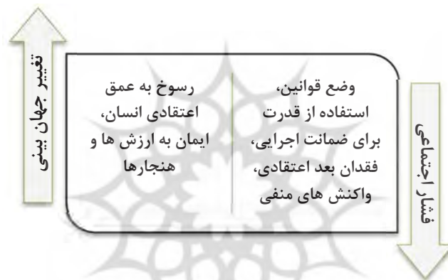
نمودار تمایزات دو رویکرد در مدیریت گسست‌های اجتماعی

چون ژرف بنگریم برای مدیریت گسست‌های اجتماعی نیز دو راهکار وجود دارد: یکی آنکه از طریق فشار اجتماعی، یا مجبور کردن انسان‌ها به قبول هنجارها و رعایت آن هنجارها در عمل، صورت می‌گیرد که ابزار آن، قوانین و مقررات و ضامن اجرای آن، قدرت مسلح است. این شیوه به‌واقع ضعیف‌ترین طریق کنترل اجتماعی است. بسیار آسیب‌پذیر است، در عمق وجود انسان‌ها رسوخ نمی‌کند، درونی نشده است و چون فاقد بُعد اعتقادی است، واکنش‌های منفی نیز پدید می‌آورد. دیگر آنکه از طریق اقناع یا رسوخ به عمق اعتقادی انسان‌ها و دگرگون‌سازی جهان‌بینی افراد و تأثیر بر جهان‌بینی آنان و با تأثیر بر جهان عقیدتی، مرامی و اندیشه اعضای جامعه و یا گروه می‌تواند هر عضوش را نه‌تنها مؤمن به هنجارها و ارزش‌های مقبول خود کند و وی را به رعایت آنان وادارد، بلکه او را حافظ و نگاهبان تمامی پذیرفته‌هایش سازد. قرآن کریم و معصومان علیهم‌السلام شیوه دوم را برای مدیریت گسست‌های فعال اجتماعی برگزیده‌اند.