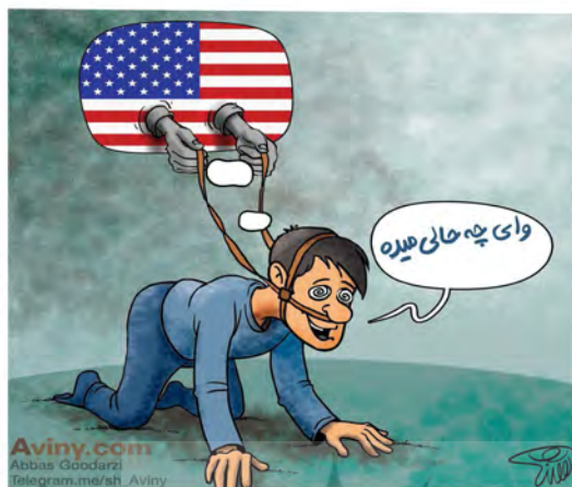
شکل شماره ۸- بندگی غرب

شرکت‌های کشورهای غربی به داخل کشور دیگر توان تولید را از دست داده و تولید ملی با نقصان و ضعف بسیار شدیدی روبرو خواهد شد.