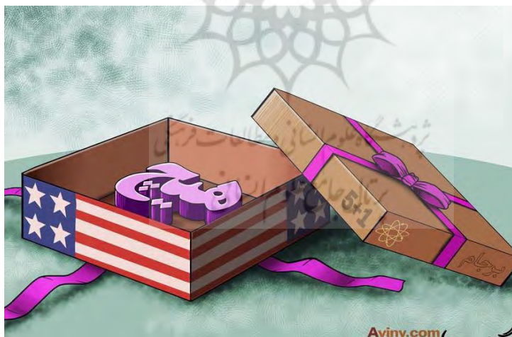
شکل شماره ۲ - نتیجه‌ی برجام

آنچه در سطح دلالت ضمنی این تصویر می‌توان گفت این است که در انجام مذاکرات هسته‌ای نمایندگان کشور ایران از سوی کشورهای ۵+۱ تحت فشار بوده‌اند و توافق بدست آمده نتیجه فشار کشورهای غربی و آمریکا است. گرز موجود در کنار دست طرف ۵+۱ تداعی‌گر این فشارها و تحریم‌های اعمال‌شده از سوی کشورهای اروپایی و آمریکا است. عناصر نشانه‌شناختی در این تصویر کشورهای غربی و آمریکا را در موضع قدرت و انعطاف بالا در اعمال فشارهای خود بر ایران نشان می‌دهند. این برداشت را وجود صندلی راک و گرز برای طرف ۵+۱ در ذهن بیننده پدید می‌آورد و به‌طور تلویحی بیان می‌کند که طرف ۵+۱ به راحتی و سهولت منافع خود را بر منافع ایران غالب کرده و ایران را در موضع ضعف قرار داده است. همچنین، وجود تعدادی گچ و خطوط بر روی پارچه میز مذاکره به تعداد بالای جلسات مذاکره به صورت ضمنی دلالت می‌کند و آن را امری فرسایشی به تصویر می‌کشد. علاوه بر این‌ها، رنگ بنفش موجود در پس زمینه عکس که به صورت مه‌آلود به تصویر کشیده شده است خبر از فرجام پرازابهام و نامعلوم مذاکرات می‌هد و به نوعی فضای کلی گفتمان دولت یازدهم را توصیف می‌کند.