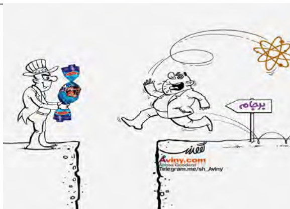
شکل شماره ۵- تله مذاکرات هسته‌ای

تصویر حاضر به روند پیشرفت مذاکرات هسته‌ای دلالت می‌کند که در آن «انرژی هسته‌ای»، «مسیر توافقات»، «حرکت با شتاب طرف مذاکره کننده‌ی ایرانی»، «شکاف موجود در مسیر»، «طرف اروپایی» و «شکلات در دست او» بسیار برجسته و حائز اهمیت می‌نماید. هرکدام از این اجزا جنبه‌ای از مذاکرات را بازنمایی می‌کنند. همبود آن‌ها معنایی گفتمانی و ایدئولوژیک را در راستای نقد برجام به مخاطب القا می‌کنند.