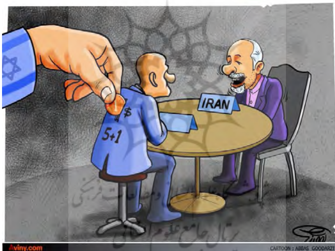
شکل شماره ۳- پشت پرده مذاکرات

بنفش و به صورت برجسته قرار داده شده است. در سطح دلالت ضمنی، این تصویر به نتیجه‌ی مذاکرات هسته‌ای ایران و کشورهای ۵+۱ اشاره می‌کند که علیرغم تلاش‌های فراوان تنها پیامد آن «هیچ» به تصویر کشیده شده است. رنگ بنفش ربان‌های روی جعبه به‌طور تلویحی بیان می‌کند که نتیجه «هیچ» ماحصل برنامه‌های هسته‌ای دولت یازدهم است. تصویر جعبه هدیه به‌صورت کنایی حکایت از آن دارد که امتیازات و دست‌آوردهایی که دولت از آن با افتخار یاد می‌کند در مقابل امتیازات اعطا شده به طرف مقابل فاقد ارزش و وجاهت است. همچنین نقش شدن تصویر پرچم آمریکا به دور جعبه حاکی از سلطه و هژمونی آمریکا بر روی کشورهای ۵+۱ و داشتن دست بالا در تصمیم‌گیری‌های مرتبط با توافق هسته‌ای است.