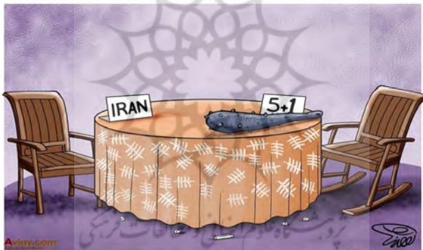
شکل شماره ۱- مذاکرات زیر شیخ تهدید

برای توصیف دلالت مستقیم در این تصویر لازم است ابتدا به توصیف عناصر شکل‌دهنده تصویر پرداخته شود. در سطح کلی، این تصویر به مذاکره بین ایران و کشورهای ۵+۱ دلالت دارد. در این تصویر، یک میز گرد، دو عدد صندلی و یک عدد گرز در طرف مذاکره کننده تیم ۵+۱ عناصر فضا ساز را تشکیل می‌دهند. در این تصویر، برای کشورهای ۱+۵ صندلی راک و برای مذاکره کنندگان ایرانی صندلی معمولی طراحی شده است. افزون بر این‌ها، تکه‌های گچ بر روی زمین و خطوطی روی پارچه رومیزی مشاهده می‌شود. رنگ پس‌زمینه تصویر بنفش انتخاب شده که منتسب به دولت یازدهم است.