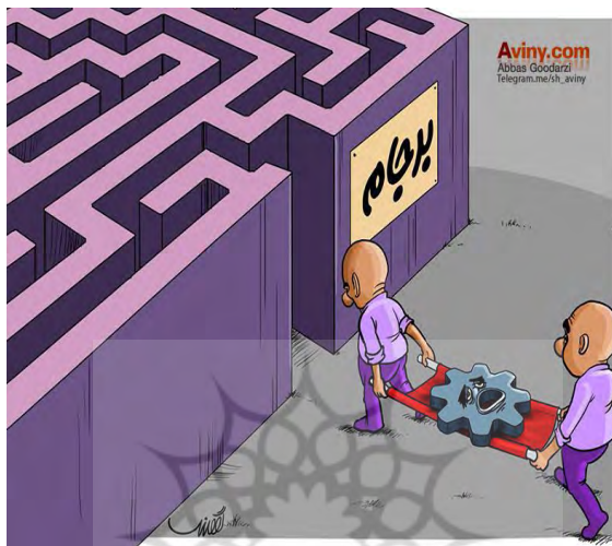
شکل شماره ۷ - عاقبت نامعلوم صنعت کشور پس از برجام

می‌نماید. موضوع تامین امنیت اسرائیل در مقابل ایران نیز باعث شده است که ایران در موضع ضعف قرار گیرد و نماینده‌ی ایران بخاطر رعب از اسرائیل و آمریکا و اشتیاق برای کسب امتیازات ناچیز و کم‌ارزش نفوذ همه‌جانبه‌ی اسرائیل در مذاکرات را «جذابیت» فرض می‌کند.