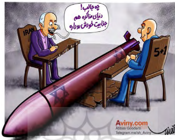
شکل شماره ۶ - جذابیت‌های دنیای مذاکرات

قطره‌های آب دهان وی تداعی می‌شود) به طمع دریافت امتیازاتی بسیار ناچیز، مهم‌ترین سرمایه‌ی کشور را در اختیار دولت‌های غربی قرار داده است.