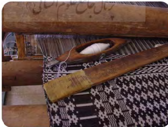
شکل ۱: احیای احرامی بافی