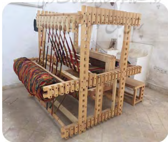
شکل ۳: دستگاه دارایی