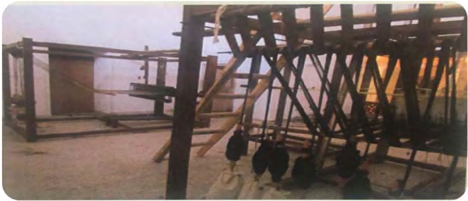
شکل ۴: دستگاه ترمه