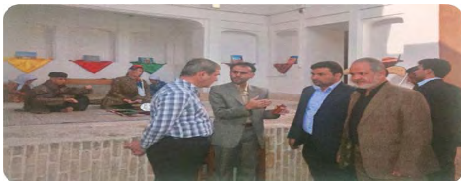
شکل ۲: افتتاح موزه نساجی