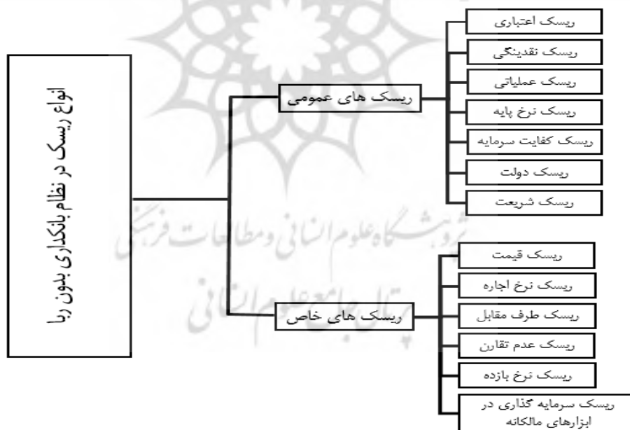
شکل ۱- مدل نظری تحقیق

در این پژوهش ابتدا ریسک‌های شناخته شده در بانکداری بدون ربا شامل ریسک‌های عمومی و ریسک‌های خاص نظام بانکداری بدون ربا متناسب با ابزارها و قراردادهای خاص این نظام به ویژه در زمینه عقود اسلامی مبادله‌ای و مشارکتی شناسایی شدند. (شکل ۱)