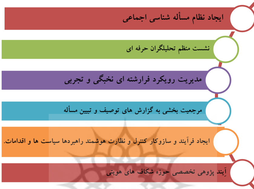
شکل شماره ۱: الزامات توسعه ظرفیت اندیشکده‌های راهبردی

از منظر آسیب‌شناسی در حال حاضر با انبوه مصوبات و تصمیمات و سیاست‌هایی مواجه هستیم که به دلایل مختلف اجرا نشده و معطل باقی مانده‌اند و به‌رغم پذیرش و تصویب آنها، در حوزه مسائل هویتی با ضعف اجرا و پیاده‌سازی مواجه هستیم و تنها زمانی که نوک کوه یخ چالش‌ها یا تهدیدات هویتی کشور از آب بیرون می‌زند هر دستگاهی از قبیل ارشاد یا دبیرخانه شورای عالی امنیت ملی، آموزش و پرورش و یا نهادهای امنیتی و...، تصمیمات عکس‌العملی و انفعالی را برای اقدام در قالب جزیره‌ای و براساس شرح وظایف سازمانی خود تصویب و برای مدتی اجرا می‌کنند که عمده‌تاً به‌طور ناقص اجرا می‌شود و حتی در صورت اجرا نیز به دلیل فقدان نگاه و رویکرد جامع و هم‌افزایی بین دستگاه‌ها، فاقد کفایت اثربخشی در حل مسأله است. علت این امر به دو مسأله یکی فقدان نگاه سیستمی (۶) منسجم به مسائل هویتی ایران و ایجاد یک سیستم مدیریتی که از مسأله‌شناسی تا اجرا؛ همواره نسبت به اقدامات و رخدادها و روندشناسی و اصلاح تصمیمات و ممانعت از غفلت راهبردی و ضعف و عدم اجرای مصوبات، گزارش و رصد و بازخورد مستمر ارائه نماید. ارائه گزارش‌های مستمر و منظم، به‌طور مستقیم و غیرمستقیم سبب تشویق و نیز بازدارندگی مجریان و پرهیز از