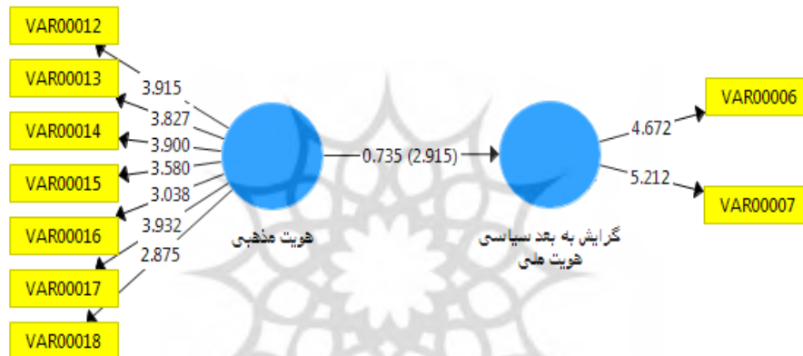
شکل شماره ۳: روابط بین متغیرهای گرایش به بعد سیاسی هویت ملی و هویت دینی

در این قسمت گویه‌های مرتبط با شاخص‌های سیاسی هویت ملی (اعتماد به نظام سیاسی کشور، آگاهی از اخبار و وقایع جاری و روزمره و حمایت از حکومت موجود) با گویه‌های هویت دینی مورد بررسی قرار می‌گیرد. خروجی نرم‌افزار با توجه به شکل ۳ نشان‌دهنده‌ی مناسب بودن مدل ساختاری است زیرا ضریب معنی‌داری برابر ۲/۹۱۵ بزرگتر از ۱/۹۶ است. با توجه به نتایج به دست آمده از مدل‌سازی به روش معادلات ساختاری و ضرایب معنی‌داری، بین این گویه‌ها نیز ارتباط معنی‌داری وجود دارد، یعنی ضریب همبستگی ۰/۷۳۵، همبستگی مثبت، معنادار و با شدت بالایی را نشان می‌دهد. به این معنا که هرچه گرایش به هویت دینی قوی‌تر شود، پایبندی به شاخصه‌های سیاسی هویت ملی نیز بیشتر می‌شود.