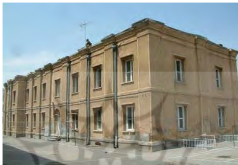
تصویر شماره ۱: ساختمان دبیرستان توحید تبریز

دبیرستان توحید یکی از قدیمی‌ترین دبیرستان‌های شهر تبریز است که در خیابان شریعتی قرار دارد و قدمت آن به دوران پهلوی اول می‌رسد. معماری دوران پهلوی کاملاً در ساختمان مدرسه مشهود است. بنا شامل سه طبقه، زیر زمین، همکف و اول و نیز سه ورودی در شمال و جنوب و غرب ساختمان است.