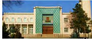
ساختمان استانداری که اکنون تبدیل به موزه شده است