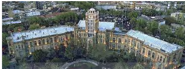
تصویر شماره ۵: عمارت شهرداری تبریز، دوره پهلوی اول، سبک نئوگوتیک