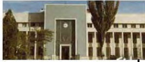
بانک ملی تبریز (شعبه مرکزی) که در دوره پهلوی دوم ساخته و به مجموعه اضافه گردید.