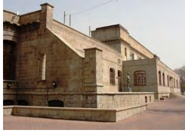
تصویر شماره ۶: کتابخانه ملی سابق تبریز

ساختمان سابق کتابخانه ملی تبریز یکی دیگر از بناهای تاریخی این شهر به‌شمار می‌رود که در ضلع شمالی باغ گلستان قرار دارد. ساخت بنای کتابخانه ملی تبریز در سال ۱۳۱۳ خورشیدی آغاز شد و در سال ۱۳۱۸ خورشیدی توسط انجمن شهر تبریز مورد استفاده قرار گرفت. از دیدگاه معماری، پلان ساختمان کتابخانه ملی سه بخش دارد، که بخش میانی به شکل سالن و بخش‌های جنوبی و شمالی به اتاق‌های مختلفی تقسیم شده‌اند. نمای بیرونی بنا از نوعی سنگ محلی به نام اسپراخون ساخته شده و سنگبری‌های به کار رفته در کل بنا، به‌ویژه در بخش‌هایی مانند طاق پنجره‌ها و کنگره‌هایی با نقش گل در انتهای دیوارها بسیار شبیه به معماری عمارت شهرداری تبریز است.