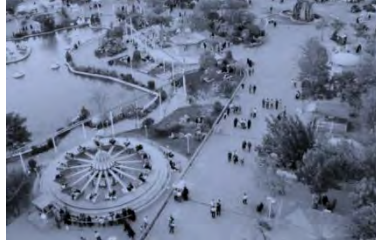
تصویر شماره ۳: باغ گلستان

پس از احداث خیابان پهلوی، اقدامات وسیعی از سال ۱۳۰۶ در زمینه بازگشایی خیابان‌های متعدد منشعب از خیابان پهلوی آغاز شد. این خیابان‌ها که بعدها به ترتیب: شاهپور جنوبی، فردوسی، منجم، خاقانی و منصور نامیده شدند در فاصله سال‌های ۱۳۱۰-۱۳۰۷ هـ.ش تکمیل شدند. در همین دوره گذر حد فاصل دروازه نوبر و دیک باشی، تعریض و به نام شهردار وقت «خیابان تربیت» نامیده شد. (بهمنش، ۱۳۸۹)