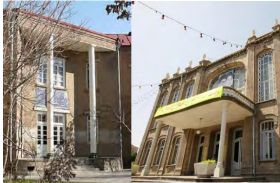
تصویر شماره ۹: ورودی بناهای حکومتی و دولتی اغلب به صورت بیرون زده و شاخص