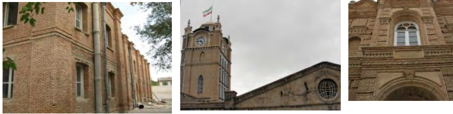
تصویر شماره ۱۰: نمای بناهای حکومتی و دولتی در دوره پهلوی، تلفیقی است از عناصر معماری سنتی و باستانی ایرانی و عناصر معماری غرب

در بناهای دیگر پهلوی اول، به خصوص مدارس، بیشتر از نمای آجری و با تزئینات آجری ساده و پنجره‌های عمودی معماری پهلوی استفاده شده است.