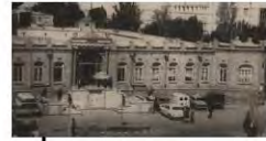
عمارت شهرستانی که در دوره پهلوی دوم تخریب شد.