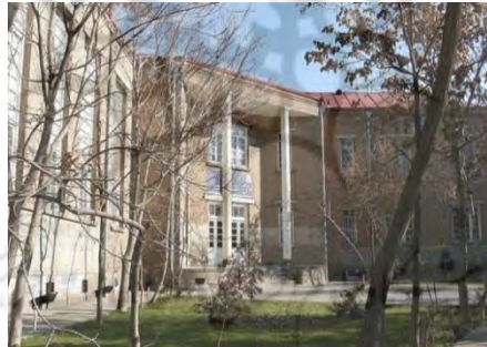
تصویر شماره ۷: ساختمان دانشسرای عالی تبریز

عملیات ساخت ساختمان دانشسرای فعلی در سال ۱۳۱۵ خورشیدی در محل سربازخانه و میدان مشق تبریز شروع شده و در سال ۱۳۱۸ خورشیدی پایان پذیرفت. گفته می‌شود در ساختمان بنای دانشسرای مقدماتی پسران تبریز، مهندسان آلمانی نیز با معماران ایرانی همکاری فنی داشته‌اند هم‌چنین این مکان به‌عنوان اولین دانشگاه تبریز فعالیت می‌کرد.