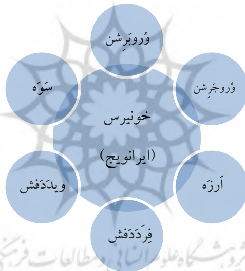
شکل شماره ۱: تقسیم‌بندی جهان براساس بندهش

تقدس و محوریت داشتن جغرافیای ایران در ذهنیت ایرانیان دوره ساسانی، در بندهش نیز انعکاس یافته است. در این کتاب، «خونیرس» به‌عنوان سرزمینی که «همه‌گونه نیکی در آن بیش آفریده شد»، در وسط و قلب جهان قرار دارد و شش سرزمین دیگر در پیرامون آن هستند. خونیرس به‌تنهایی برابر با شش اقلیم دیگر است و «ایرانویج» - جایگاه ایرانیان - در مرکز آن قرار دارد (نگاه کنید به شکل ۱). بنابر بندهش، همه نیکی‌ها ابتدا از خونیرس منشأ می‌گیرد، به‌طوری‌که «باد، نخست، ازین کشور خونیرس به شتاب به ارزه و سوه بگردد و از آنجا به شتاب به کشور فردکدفش و ویدکدفش گردد و از آنجا به شتاب به کشور خونیرس گردد». هم‌چنین، از هریک از شهرهای ایران با عنوان «بهترین سرزمین آفریده شده» یاد می‌شود. (فرنیغ‌دادگی، ۱۳۷۱: ۷۰، ۷۱، ۹۴، ۱۳۳)