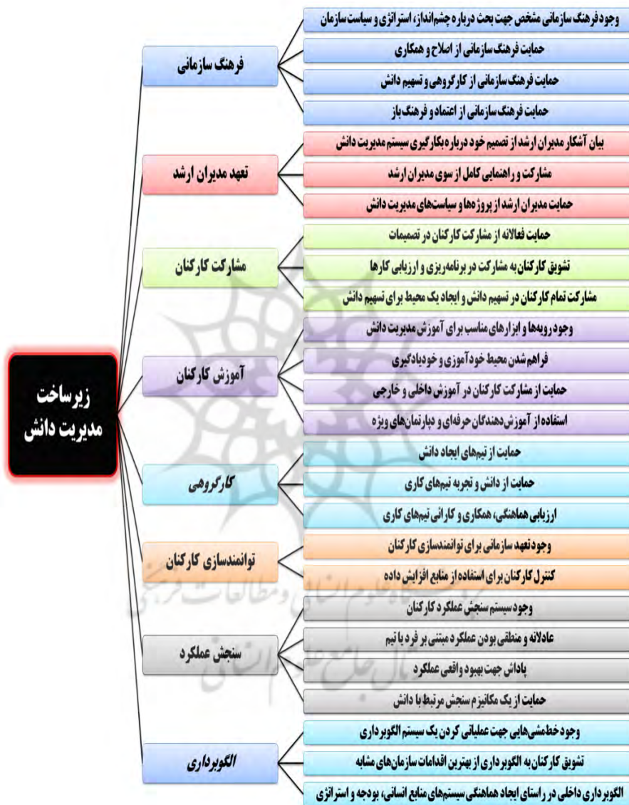
شکل ۱. الگوی عملیاتی پژوهش

پیااده سازی فرآیند مدیریت دانش در دانشگاه هدف بررسی خواهند شد. شکل ۱ نشان دهنده عوامل زیرساختی مؤثر بر مدیریت دانش در این پژوهش است.