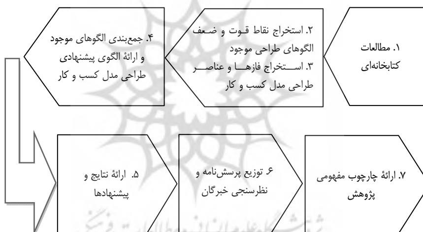
شکل ۱. نمودار فرایند پژوهش

نحوه ارتباط آنها با هم تعیین شده و برپایه یک رویکرد جامع به یکدیگر ترجمه شدند و نقاط قوت و ضعف، شباهت‌ها و اختلاف‌های هریک از الگوها مشخص شد. در فاز آخر که ارائه تلفیق است، چارچوب جدید استخراج و ارائه شد. پس از استخراج فازها و عناصر چارچوب پیشنهادی، پرسش‌نامه‌ای تهیه و در اختیار صاحب‌نظران قرار گرفت. پس از تجزیه و تحلیل پاسخ‌ها با استفاده از روش تحلیل عاملی، مؤلفه‌های استخراج‌شده الگوی پیشنهادی ارزیابی شدند. با روش تحلیل عاملی می‌توان به دسته‌بندی متغیرها و مؤلفه‌های تبیین‌کننده مفهوم پرداخت. برای انجام تحلیل عاملی، چهار گام اصلی، شامل تهیه ماتریس همبستگی از تمام متغیرهای مورد استفاده در تحلیل و برآورد اشتراک، استخراج عامل‌ها، انتخاب و چرخش عامل‌ها و تفسیر لازم است (نگهبان، ۱۳۸۲). در این پژوهش از تحلیل عاملی تأییدی برای تأیید و رد عناصر و فازها استفاده شده است.