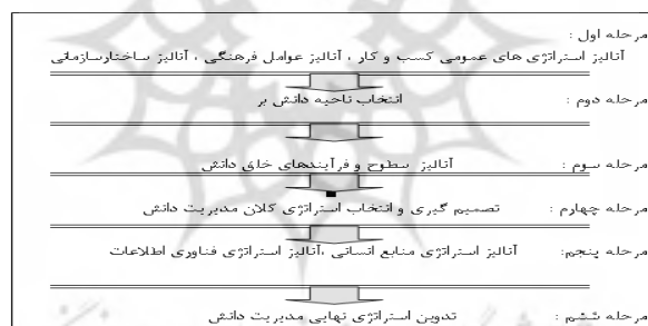
نمودار ۱. متدولوژی استفاده شده برای انتخاب استراتژی در سیستم طراحی شده

متدولوژی مورد استفاده برای انتخاب استراتژی KM در نمودار ۱ نشان داده شده است [۱].