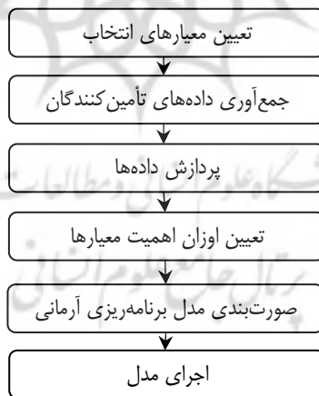
شکل ۱. فرایند پژوهش

مطابق شکل ۱، برای اجرای پژوهش حاضر گام‌های زیر طی شده است.