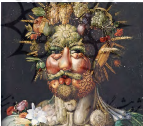
شکل ۱. مفهوم سازمان و ساختار به‌صورت شماتیک

آن مد نظر باشد این کلمات درون گیومه قرار می‌گیرند و در غیر این صورت مفاهیمی هستند که در این نظریه مطرح شده‌اند. سازمان یک سیستم به روابط بین مؤلفه‌های آن سیستم اشاره دارد و سیستم را به‌عنوان واحدی مرکب در یک طبقه خاص تعریف می‌کند و ویژگی‌های سیستم را به‌عنوان یک کل معین می‌کند. ساختار به مؤلفه‌های واقعی و روابط واقعی اشاره دارد که یک سیستم یا واحد مرکب را به‌عنوان موردی خاص از یک طبقه مشخص به وجود می‌آورد. باید توجه داشت که ساختار، ویژگی‌های سیستم به‌عنوان یک کل را تعیین نمی‌کند و از آنجا که سازمان جنبه روابط تحقق‌یافته در ساختار است، نمی‌تواند مستقل از ساختاری که آن را محقق کرده است، وجود داشته باشد (ماتورانا، ۲۰۰۲). یک سیستم، سازمان خود (هویت خود) را حفظ می‌کند در حالی که ساختار آن دائم در حال تغییر است. البته باید توجه داشت که تغییرات ساختار در چارچوب حفظ هویت سیستم یعنی سازمان آن انجام می‌گیرد. حفظ سازمان سیستم، شرط وجود آن سیستم است و اگر سازمان یک سیستم تغییر کند آن سیستم از هم می‌پاشد و چیزهای متفاوت دیگری به وجود می‌آید (وارلا، ماتورانو و یوریب، ۱۹۷۴).