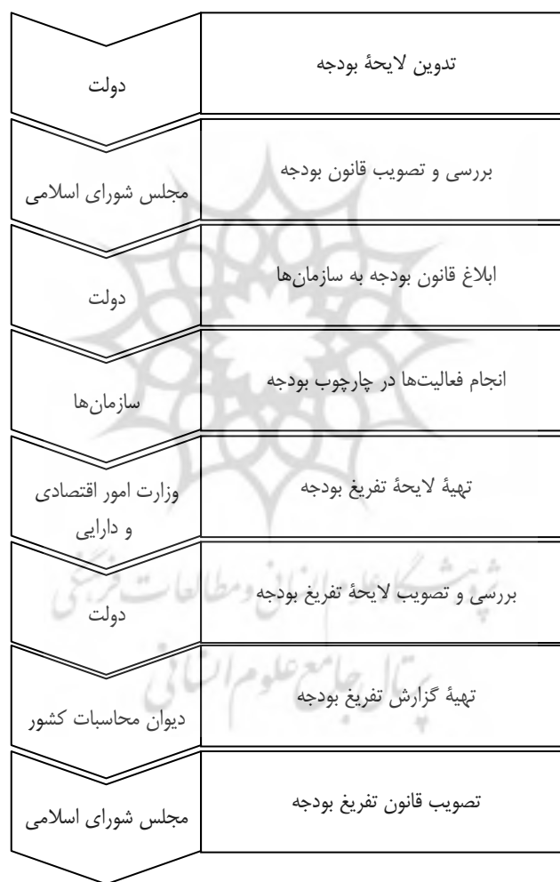
شکل ۱. مراحل تهیه لایحه بودجه تا لایحه تفریح بودجه

کشور را تهیه می‌کند. پس از تصویب این گزارش در هیئت عمومی دیوان محاسبات کشور، ریاست دیوان محاسبات آن را به مجلس شورای اسلامی تقدیم می‌کند؛ سپس گزارش تفریح بودجه از طریق «کمیسیون دیوان محاسبات و بودجه و امور مالی مجلس شورای اسلامی» در جلسه‌های علنی مجلس شورای اسلامی مطرح می‌شود. پس از تصویب قانون تفریح بودجه، مخبر کمیسیون دیوان محاسبات آن را قرائت می‌کند و در روزنامه رسمی، زیر نظر دادگستری به چاپ می‌رسد. مراحل یادشده در شکل ۱ نشان داده شده است.