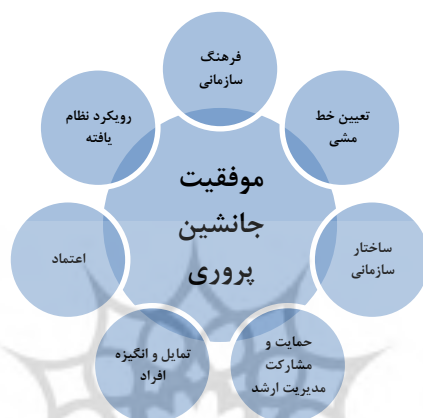
شکل ۱. مدل مفهومی تحقیق