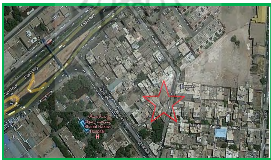
شکل ۱. شمایی از یکی از مساجد منطقه (مسجد رسالت)