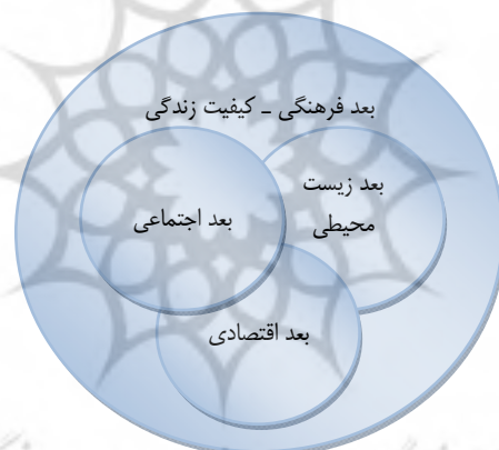
شکل ۱. مدل چهاررکنی پایداری (Runnalls, 2006)

نکته کلیدی در پایداری اجتماعی پرورش مشارکت، مبادله و احترام بین جریان‌های دولت، کسب و کار و نهادهای هنری است. فرهنگ این مشارکت‌ها را رشد می‌دهد و به سرعت نقش خود را در سیاست‌گذاری‌ها و برنامه‌ریزی‌ها در کانادا، استرالیا، زلاند نو و اروپا تقویت می‌کند.