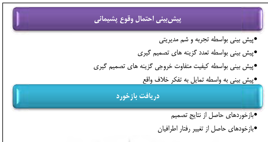
شکل ۲. تم‌های اصلی و فرعی مرتبط با توصیفات شناختی مشارکت‌کنندگان از پدیده پشیمانی استراتژیک

مد نظر بهترین تصمیم ممکن نبوده و می‌توانستید در گذشته بهتر عمل کنید؟» پدیدار می‌شود. همان‌طور که مشاهده می‌شود این تجربیات به صورت کلی در قالب دو تم اصلی و شش تم فرعی به شرح ذیل دسته‌بندی شده است.