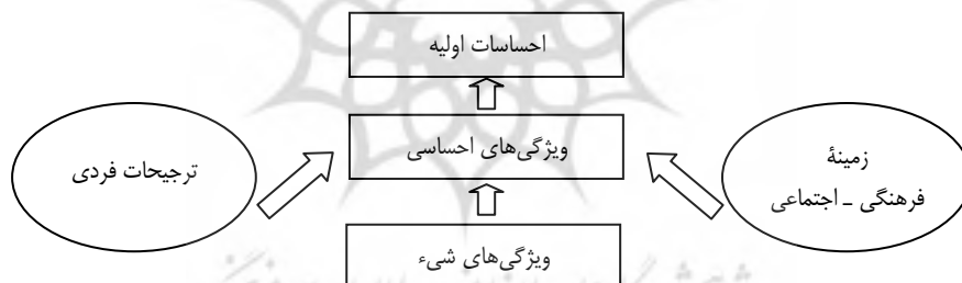
شکل ۲. مدل واکنش احساسی

رحمانیان (۲۰۱۴) در مقاله خود نقش احساس محصول و برند را بر رفتار خرید مصرف‌کننده ماکروویو (که یک کالای بادوام است) در بازار ایرانی بررسی کرده است. وی در نهایت درمی‌یابد که احساس به جای روابط خطی ساده، از طریق مؤلفه‌های پیچیده و چندوجهی، به صورت خودآگاه و ناخودآگاه بر رفتار خرید مصرف‌کننده تأثیرگذار است. بانرجی (۲۰۱۱) نیز در مقاله خود اثر نوع تبلیغات بر ذهن مصرف‌کننده، رفتار مصرف و تصمیم خرید را بررسی می‌کند و درمی‌یابد که مصرف‌کنندگان فقط به دنبال ارزش برند هستند نه ویژگی‌های محصول. بخشی از تبلیغات استفاده‌شده در این تحقیق در زمینه خودرو است، که کالایی بادوام است. بلیچولونس و همکاران (۲۰۰۹) نیز در پژوهش خود با شناسایی ویژگی‌های ظاهری که مصرف‌کنندگان برای تشخیص ظاهر لوازم خانگی بادوام استفاده می‌کنند، نحوه ادراک مصرف‌کنندگان از ظاهر محصول را بررسی می‌کنند. چاکرابارتی و گوپتا (۲۰۰۷) نیز در مقاله خود طراحی محصولات با احساسات مطلوب برای کاربران مورد نظر را کاری چالش‌برانگیز می‌دانند و تلاش دارند فرایند توسعه محصول با واکنش احساسی مطلوب را با الهام از اشیای طبیعی و مصنوعی تأیید کنند که بخشی از موارد مورد بررسی، کالای جاروبرقی به‌عنوان کالایی بادوام است. همچنین ایشان یک مدل واکنش احساسی ۱ را در تحقیق خود ارائه می‌کنند که این مدل در شکل ۲ نمایش داده شده است.