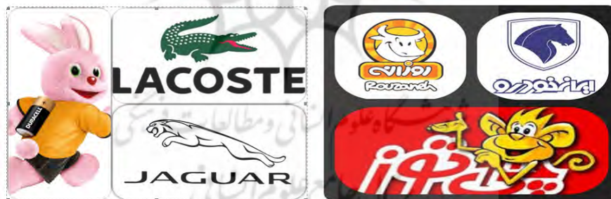
شکل ۲. مسکات‌های مطالعه‌شده در پژوهش

با توجه به توضیحات ذکر شده، مطالعه ما بر نمادهای حیوانی موجود در ۶ برند (داخلی و خارجی) شامل میمونک چی‌توز، گاو روزانه، اسب در ایران خودرو، خرگوش باطری دوراسل، پلنگ جگوار و سوسمار لاگوست، انجام شده است که تصاویر این مسکات‌ها را در شکل ۲ مشاهده می‌کنید.