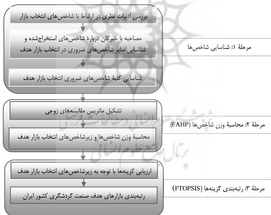
شکل ۲. چارچوب کلی پژوهش

هدف پژوهش حاضر، شناسایی و اولویت‌بندی بازارهای هدف صنعت گردشگری ایران است. در این پژوهش، متخصصان حوزه گردشگری جامعه آماری در نظر گرفته شدند و برای انتخاب خبرگان (نمونه)، از روش نمونه‌گیری هدفمند (از نوع قضاوتی) استفاده شده است. در این روش، افرادی برای نمونه انتخاب می‌شوند که می‌توانند اطلاعات مد نظر پژوهشگر را در اختیار وی قرار دهند (دانایی‌فرد، الوانی و آذر، ۱۳۹۲: ۳۲۷). بنابراین ۱۰ نفر از متخصصان حوزه گردشگری که از تجربه و سابقه ارزشمندی در حوزه اجرایی و علمی برخوردار بودند، برای نمونه انتخاب شدند. پژوهش از لحاظ هدف، کاربردی است و ابزار گردآوری اطلاعات، پرسشنامه (مصاحبه بسته) است. به‌طور میانگین به‌منظور تکمیل پرسشنامه، حدود ۴۵ دقیقه زمان برای مصاحبه بسته با هر خبره صرف شد و در چند مصاحبه فقط به توضیح درباره روند پاسخگویی به سؤال‌های پرسشنامه اکتفا شد. چارچوب کلی پژوهش را می‌توان بر اساس شکل ۲ نشان داد.