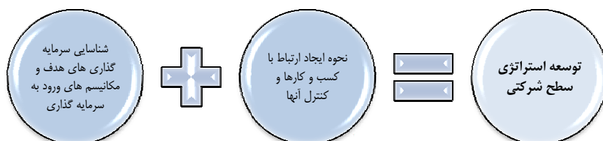
نمودار ۱. مفهوم استراتژی سطح شرکتی از نگاه گولد و همکاران [۱۰]