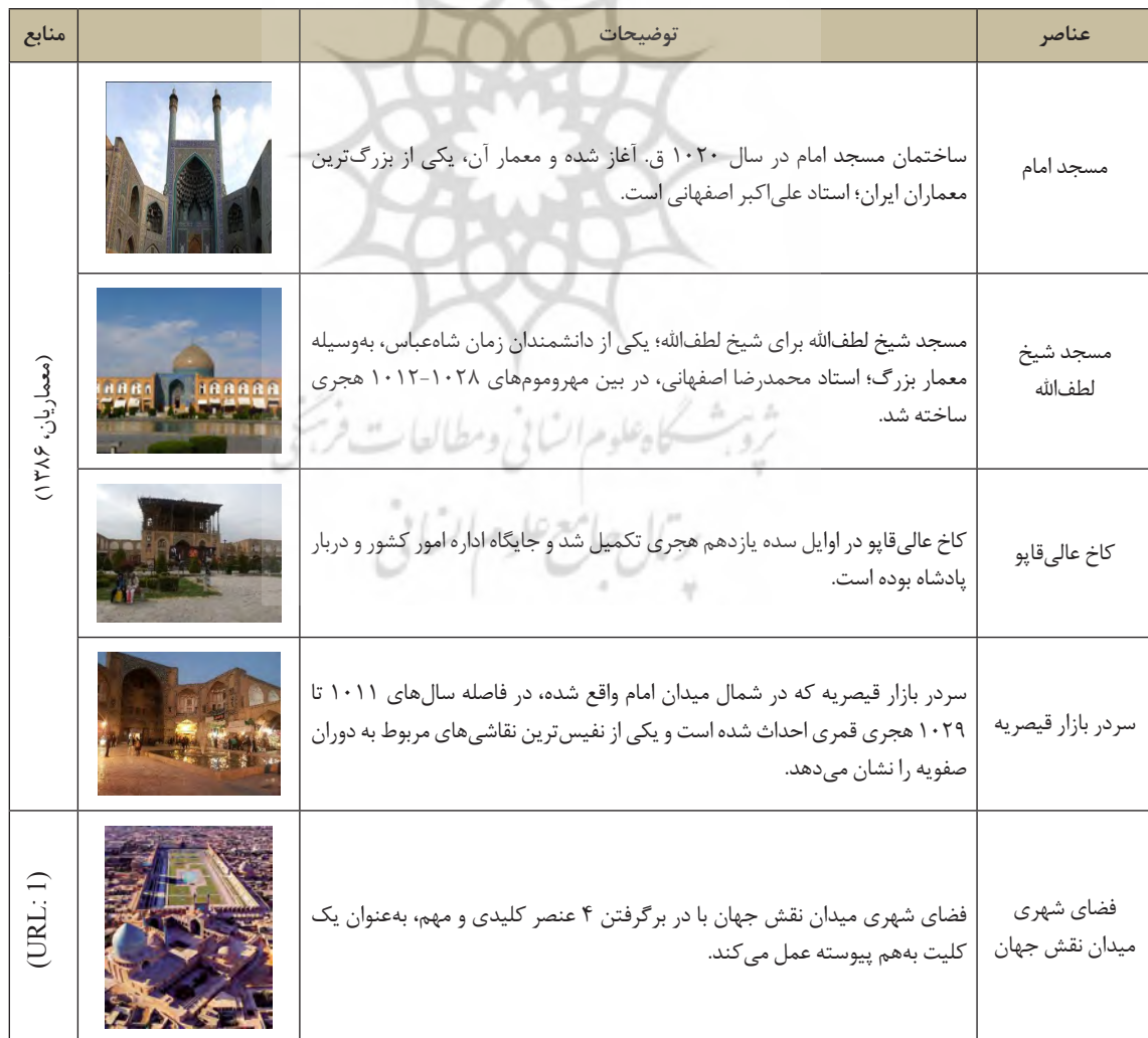
جدول ۲. عناصر میدان نقش جهان

جدول ۷، نشان‌دهنده بررسی ماتریس وزنی زیرمعیارهای ارزش اجتماعی-فرهنگی است. به لحاظ ارزش نمادین، مسجد امام، بالاترین امتیاز را به خود گرفته است. فضای میدان نقش جهان به لحاظ ارزش‌های تفریحی، هویت، تداوم خاطرات جمعی و وحدت در عین تنوع، بالاترین امتیازها را گرفته است. این نشان می‌دهد که تقریباً به لحاظ ارزش اجتماعی-فرهنگی، فضای شهری میدان نقش جهان در مجموع از وزن بیشتری برخوردار است. ماتریس وزنی زیرمعیارهای ارزش احساسی در ارتباط با ۵ مؤلفه مورد بررسی، در جدول ۸ نشان داده شده است. با توجه به این جدول مشخص شد که به لحاظ ارزش مذهبی، مسجد