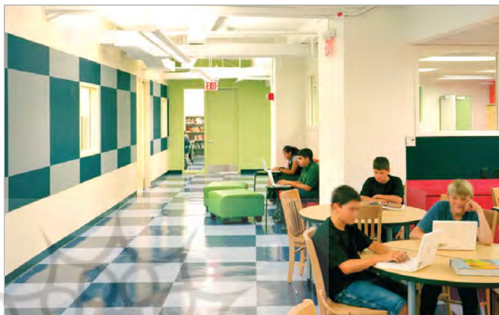
تصویر ۳. نمونه تغییر ساختار کالبدی راهرو جهت ایجاد فضای باز و منعطف (نگارنده)