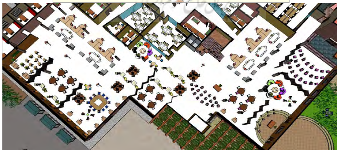
تصویر ۲. خیابان یادگیری در الگوی مدارس بدون کلاس - پروژه طراحی (نگارنده) ۲