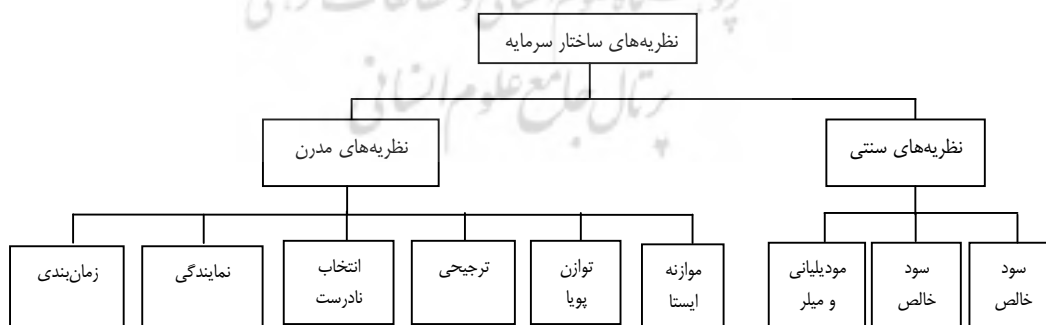
شکل ۱. نظریه‌های سنتی و مدرن ساختار سرمایه

نظریه‌های ساختار سرمایه در یک تقسیم‌بندی کلی در دو گروه سنتی و مدرن قرار می‌گیرند، به طور خلاصه دیدگاه‌های مربوط به هر رویکرد در شکل ۱ ارائه شده است. ماهیت رویکرد یا نظریه سنتی مالی اثباتی گرایانه ۵ است و هدف آن شناخت تصمیم‌گیری‌های مالی ارزشمند در طی زمان و مشخص کردن ویژگی‌های شرکت‌هایی بوده که اقدام به چنین تصمیم‌گیری‌هایی کرده‌اند. زیرا در آن زمان تصور می‌کردند که اتخاذ چنین رویکردی به تدوین مجموعه قواعدی برای تصمیم‌گیری‌های مالی خواهد انجامید (مرومار و لونکارنسکی ۶ ، ۲۰۰۲).