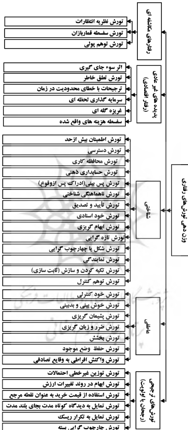
نمودار ۱. درخت سلسله‌مراتبی