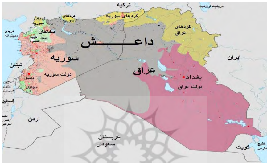
نقشه ۳: مناطق تحت تصرف داعش

( Reference: http://www.yjc.ir/fa/news/4974301 )