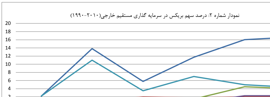
Source: The BRICS Report 2012. India: Oxford University Press, 2012