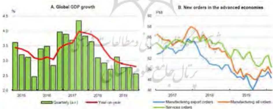
شکل ۲. سرعت رشد جهانی کاهش یافته است

تجارت جهانی نیز بسیار ضعیف مانده است. حجم معاملات بازرگانی در سه‌ماهه چهارم سال ۲۰۱۹ و به طور کلی در سال ۲۰۱۹ کاهش یافت که از سال ۲۰۰۹ تاکنون بی‌سابقه بود (شکل ۳، پنل الف). ترافیک کانتینری بنادر و ترافیک حمل‌ونقل هوایی نیز پیش از شیوع کرونا و پیروس کاهش یافته بود و به نظر می‌رسد سقوط شدیدتری در کوتاه‌مدت اتفاق می‌افتد. اقدامات زمینه‌یابی برای تولید سفارشات صادراتی جدید رو به افزایش بود اما در زمینه‌یابی موسسه مدیریت پروژه (PMI) در ماه فوریه و به‌ویژه ژاپن و استرالیا دچار افت شد. داده‌های سرمایه‌گذاری نیز ضعیف هستند و به دلیل عدم اطمینان مداوم و ضعف پیش‌بینی شده در رشد جمعیت آینده، سرمایه‌گذاری تا حدودی متوقف شده است. رشد سرمایه‌گذاری انبوه در اقتصادهای گروه ۲۰ (به استثنای چین) در اوایل سال ۲۰۱۸ از نرخ سالانه ۵ درصد پایین آمد و به تنها ۱ درصد در سال گذشته رسید.