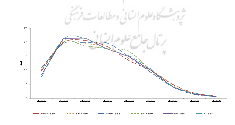
نمودار ۱-۲: الگوی سنی جمعیت دانش‌آموختگان شاغل دارای تحصیلات عالی (۶۴-۲۰ ساله) برحسب گروه‌های سنی ۵ ساله و به تفکیک دوره ۹۴-۱۳۸۴

نکته مهم، این است که سهم نسبی جمعیت شاغل دارای تحصیلات عالی در گروه سنی ۲۴- ۲۰ ساله در ابتدای دوره (۱۳۸۵-۱۳۸۴) نسبت به پایان دوره در سال ۱۳۹۴، با افت‌وخیزی همراه بوده و از ۹/۹ درصد به ۷/۷ درصد کاهش یافته است. این درحالی است که این الگوی سنی در جمعیت دانش‌آموخته شاغل دارای تحصیلات عمومی، تغییرات محسوسی را نشان داده، بطوری که سهم این گروه سنی (۲۴-۲۰ ساله) در ابتدای دوره (۱۳۸۵-۱۳۸۴) نسبت به پایان دوره در سال ۱۳۹۴، از ۱۹/۲ درصد با روند کاهشی به ۹/۸ درصد رسیده است. این الگو، در سایر گروه‌های سنی در بین دانش‌آموختگان آموزش عالی و عمومی به تقریب، روند نسبتاً مشابهی را تا پایان دوره تجربه می‌کند. نمودار شماره (۱-۲) و (۲-۲)، تفاوت در الگوهای سنی این دو گروه را به روشنی در بین دوره‌های مختلف مطالعه، نشان می‌دهد.