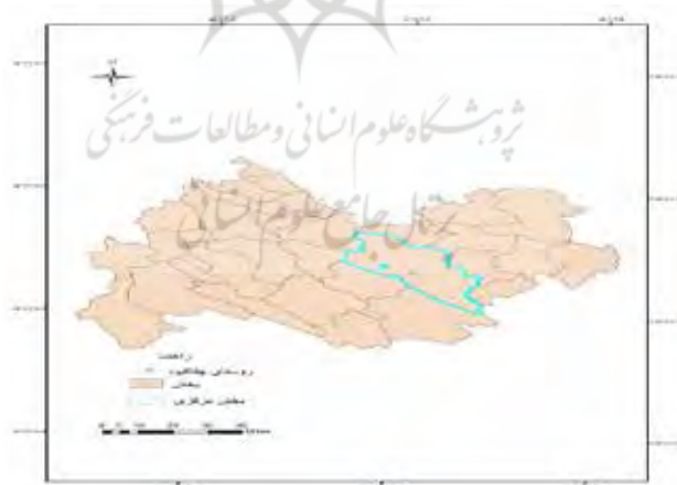
نقشه ۱: منطقه مورد مطالعه

همچنین در نقشه ۱ موقعیت جغرافیایی روستای مورد تحقیق ترسیم شده است.