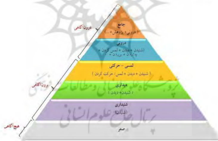
شکل ۲. هرم آموزش هیجامد پیش‌قدم

افزون بر این سطوح پیش‌قدم، ابراهیمی و طباطبائیان (۱۳۹۸) در اثر «رویکردی نوین به روان‌شناسی آموزش زبان» الگوی هیجامد را گسترش داده و با افزودن سطح جدیدی به آن الگوی هیجامد مبسوط extended model of emotioncy را طراحی کردند و سطح هیجامد مرجع metavolvement را بر آن افزودند که بر اساس آن فرد به فراآگاهی می‌رسد و این یعنی او چنان بر موضوع مسلط شده است که توانایی تدریس آن بر دیگری را دارد (پیش‌قدم، ابراهیمی و طباطبائیان، ۱۳۹۸). با توجه به جایگاه هیجانات و حواس فراگیران در مراحل یادگیری می‌توان در فرآیند آموزش از آن‌ها استفاده کرد، در همین راستا پیش‌قدم (۲۰۱۶) هرم آموزشی هیجامد را به شرح زیر ارائه کرده است: