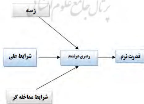
شکل ۱. مدل مفهومی اولیه پژوهش

با توجه به ماهیت پژوهش که پژوهشی آمیخته (کیفی - کمی) و از نوع متوالی اکتشافی می‌باشد، محققان در مرحله‌ی اول به دنبال شناسایی عوامل علی، زمینه‌ای و ساختاری رهبری هوشمند اسلامی ایرانی با استفاده از روش تحلیل محتوا و فراترکیب بودند و در بخش کمی به آزمون مدل علی ارائه شده در بخش کیفی پرداخته شده است. در این راستا برای کشف مؤلفه‌ها و تقسیم‌بندی آنها برای رسیدن به مدل نهایی رهبری هوشمند مبتنی بر قدرت نرم بر اساس (شکل ۱) عمل خواهد شد.