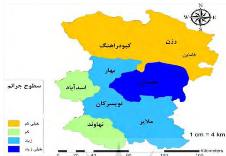
شکل ۴. نقشه پراکنندگی جرائم در شهرستان‌های استان همدان

از لحاظ میزان جرائم اجتماعی، به ترتیب شهرستان‌های همدان، ملایر و تویسرکان، و از لحاظ جرائم فرهنگی و اقتصادی، شهرستان‌های همدان، ملایر و بهار بالاترین رتبه را داشته‌اند. سایر اطلاعات در جدول ۲ ارائه شده است.