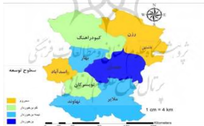
شکل ۳. نقشه پراکنندگی توسعه در شهرستان‌های استان همدان

از لحاظ سطوح توسعه اجتماعی، شهرستان همدان برخوردار، شهرستان‌های بهار، ملایر و اسدآباد نیمه‌برخوردار، شهرستان‌های تویسرکان و نهاوند کم‌برخوردار و شهرستان‌های فامنین، کبودرآهنگ و رزن محروم هستند. از لحاظ توسعه فرهنگی، شهرستان همدان برخوردار، بهار، ملایر و تویسرکان نیمه‌برخوردار، کبودرآهنگ کم‌برخوردار و شهرستان‌های نهاوند، فامنین، اسدآباد و رزن محروم‌اند. همچنین از لحاظ توسعه اقتصادی، شهرستان‌های همدان و بهار برخوردار، ملایر و نهاوند نیمه‌برخوردار، رزن و کبودرآهنگ کم‌برخوردار و شهرستان تویسرکان، اسدآباد و فامنین محروم هستند. براساس شکل ۳، به لحاظ توسعه، شهرستان همدان دارای وضعیت برخوردار، شهرستان‌های ملایر، بهار و نهاوند دارای وضعیت نیمه‌برخوردار، شهرستان‌های تویسرکان و کبودرآهنگ دارای وضعیت کم‌برخوردار و شهرستان‌های فامنین، اسدآباد و رزن محروم بوده‌اند.